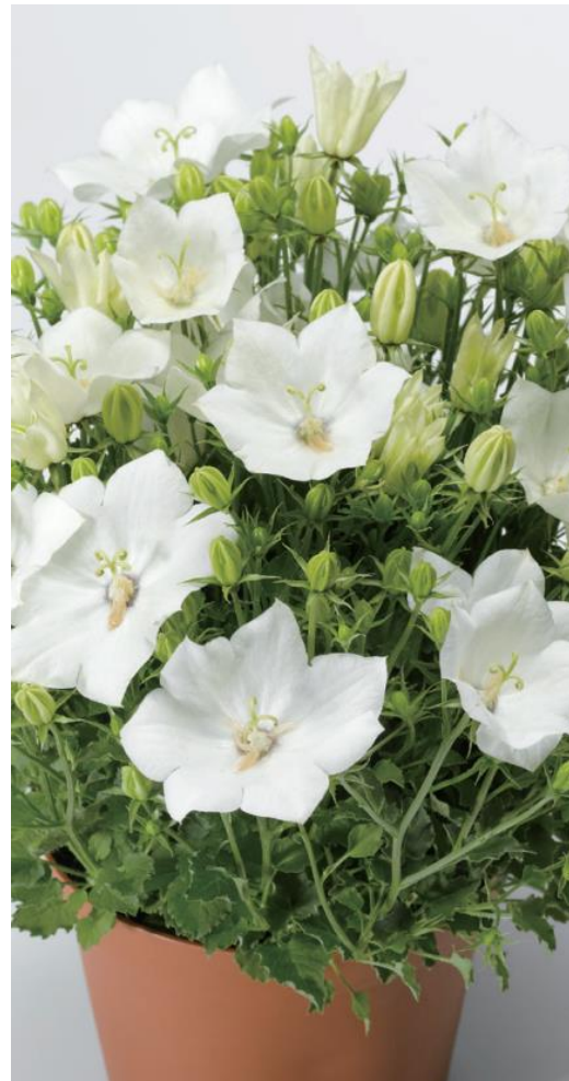
ホワイト (白ポット)