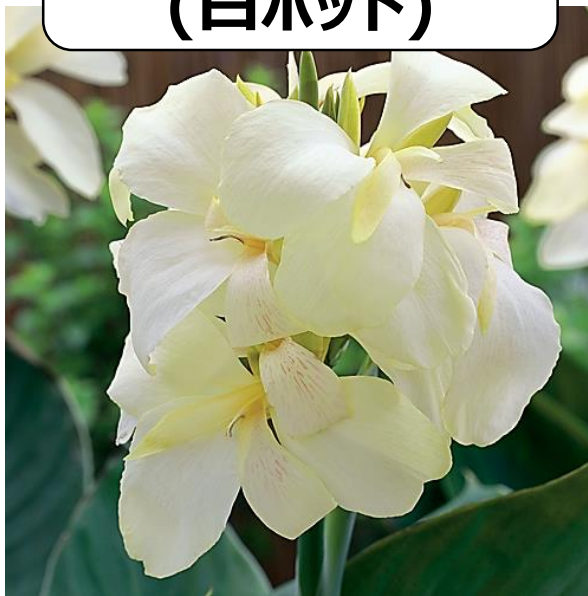
アイボリー (白ポット)