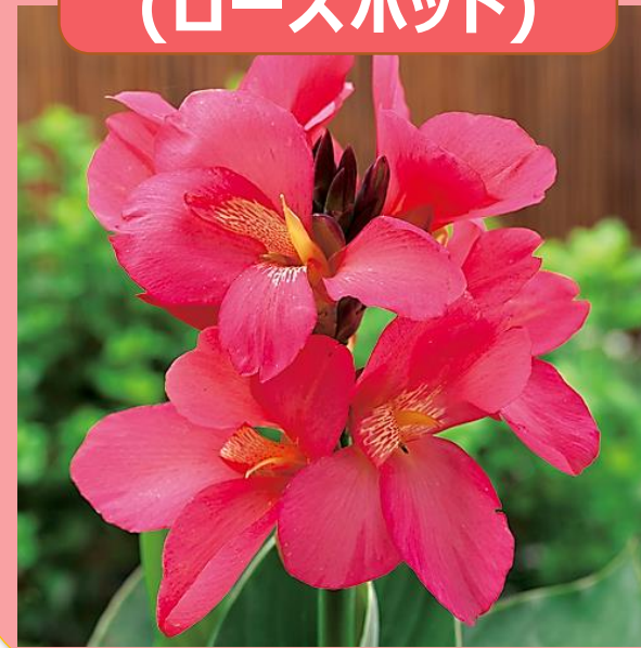
ローズ (ローズポット)